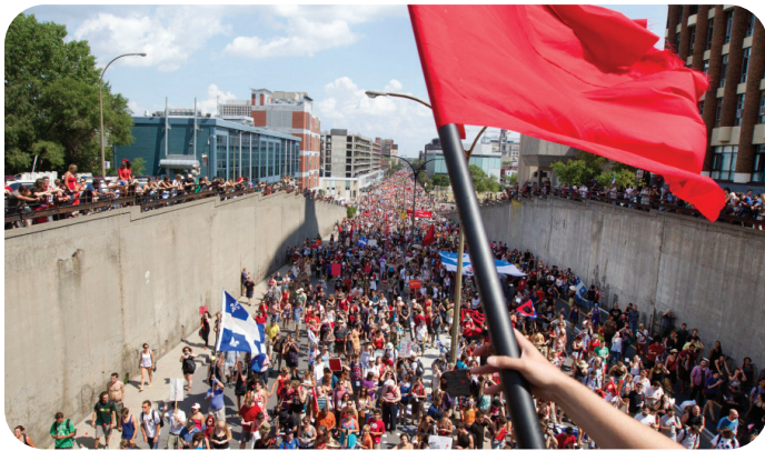
Printemps érable, Montréal, 2012

b) Parmi les qualités énumérées précédemment, lesquelles crois-tu posséder ?