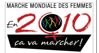
Logo MMF : © Rouleau-Paquin design

18h30 - Spectacle mis en scène par Patricia Powers