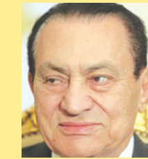
L'ex-président égyptien Hosni Mubarak

Il s'agit, selon le quotidien britannique The Guardian , de la fortune amassée par l'ex-président égyptien Hosni Mubarak durant les 30 années qu'il a passé au pouvoir. Une fortune amassée au détriment des 80 millions d'Égyptiens.