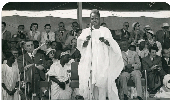
AHMADOU AHIDJO, PREMIER PRÉSIDENT DU CAMEROUN

Quelques décennies plus tard, en 1960, le « Cameroun français » et le « Cameroun anglais » se sont séparés et sont