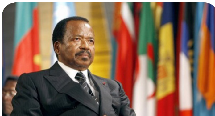
PAUL BIYA, PRÉSIDENT ACTUEL

Puis, en 1972, le président camerounais qui était au pouvoir a retiré plusieurs droits à la minorité anglophone de la population. Il a créé une république centralisée comptant huit provinces francophones et deux provinces anglophones. Mon pays a ainsi encore une fois changé de nom et est devenu la République du Cameroun.