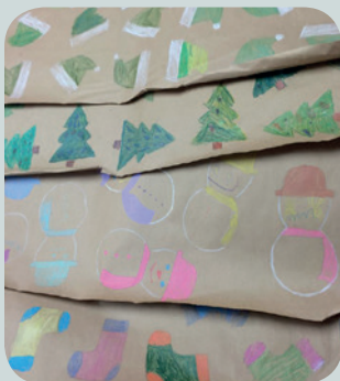
École des Boisés

À l'école des Boisés de Saint-Alexis-des-Monts, plusieurs initiatives ont été mises en place afin de favoriser des comportements plus écologiques dans la communauté. Par exemple, lors de la préparation de la fête de Noël, de jolies boules de Noël sont fabriquées à partir d'ampoules réutilisées et les élèves apprennent à décorer leur propre papier d'emballage.